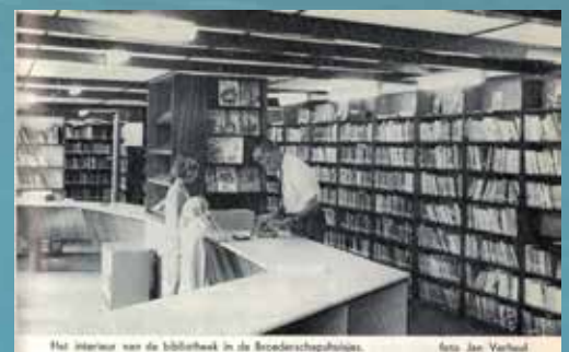
Het interieur van de bibliotheek in de Broederschapshuisjes.

Bij het zebrapad voor de huisjes steek je over en gaat de Odenveldlaan in. Ga nu de tweede zijstraat rechts, Broederschapslaan, in en rij deze helemaal uit tot hij overgaat in het Hampad. Volg het Hampad en steek voorzichtig de Parkweg over.